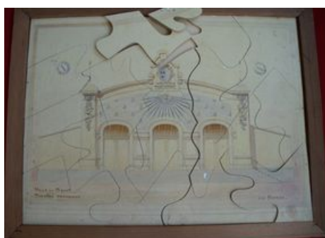
Puzzle théâtre en bois place de la Liberté