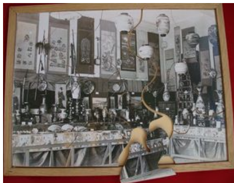
Puzzle société académique de Brest