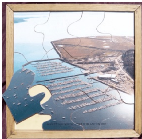
Puzzle Port et polder du Moulin Blanc en 1987

Ces jeux sont disponibles pour les écoles, les centres aérés... après réservation en contactant Hugues COURANT au 02-98-34-26-13 ou par mail : hugues.courant@brest-metropole.fr