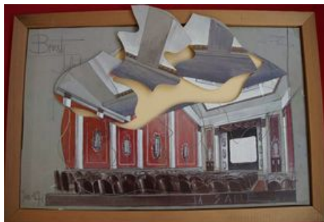
Puzzle cinéma Le Select