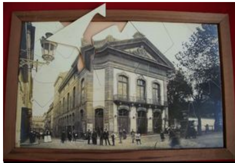
Puzzle théâtre rue d'Aiguillon

Dernière mise à jour le : 22 novembre 2018