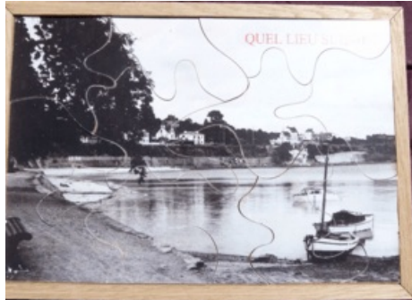
Puzzle Quel lieu suis-je ?